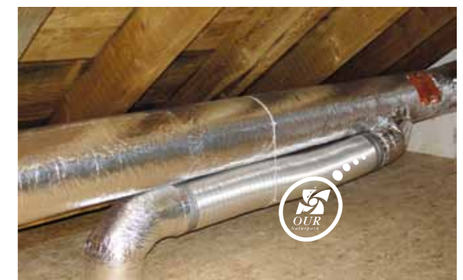
Luftleitungen mit Schalldämpfer