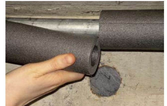
Dämmung der Leitungen